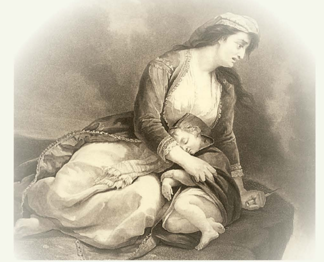
Απάντηση του Λάμπρου Τζαβέλλα στην επιστολή του Αλή Πασά:

«Αλή πασά, χαιρόμαι όπου εγέλασα ένα δόλιο.